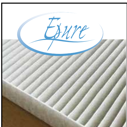
Filter ePM10 \geq 50 % (ISO 16890)

Basierend auf seiner Kompetenz im Bereich der Luftbehandlung hat CIAT den Epure-Filter mit seiner besonders hohen Filterleistung entwickelt.